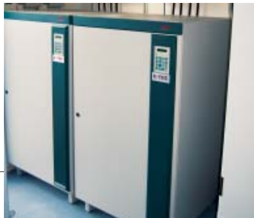
Redundante USV-Systeme 2 x 60kW