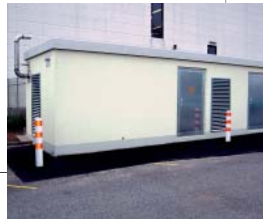
Container mit Conpower-System